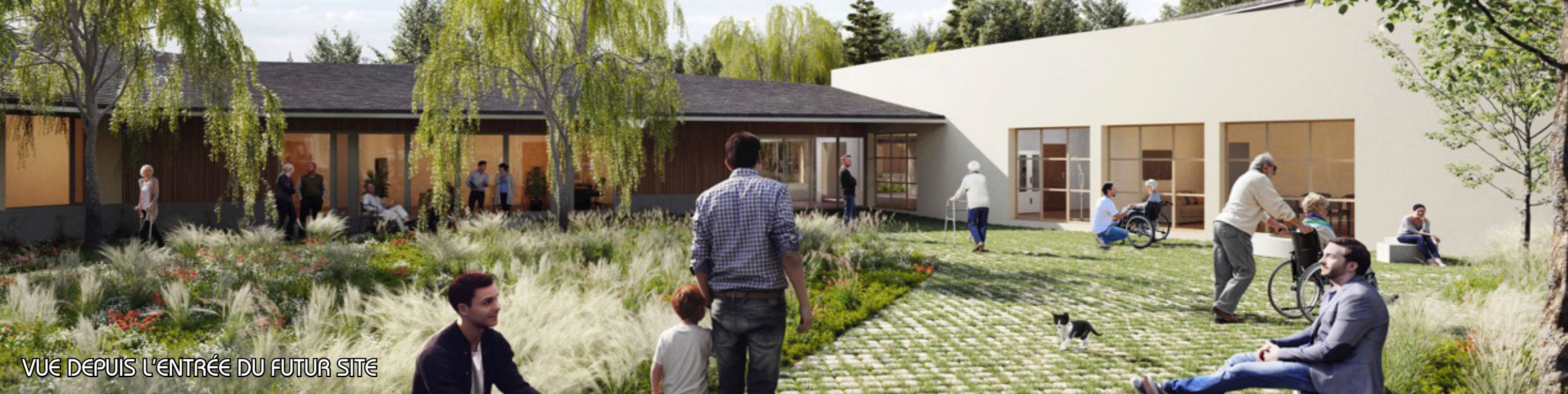
VUE DEPUIS L'ENTRÉE DU FUTUR SITE