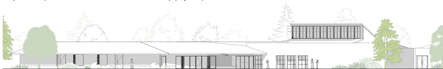
FAÇADE EST - 1/200

Cette phase 2 du Schéma Directeur Immobilier correspond à une adaptation de l'offre de soins et d'hébergement pour les personnes en situation de handicap psychique sur le territoire Ardennais.