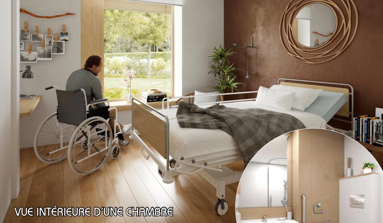
VUE INTÉRIEURE D'UNE CHAMBRE